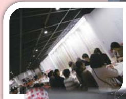
世界にひとつだけのマイカップヌードル作り