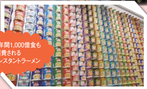
全世界で年間1,000億食も消費される世界のインスタントラーメン

舞州工場は、有名なウイーンの芸術家であるフリーデンスライヒ・フンデルトヴァッサー氏がデザインした、世界中でも2カ所にしかないごみ処理場です。“自然界には直線や、全く同一のものは存在しない”との主張から、意識的に曲線が多く用いられたデザインとなっており、建物は自然との調和の象徴として多くの緑で囲まれています。