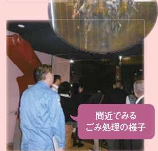
間近でみるごみ処理の様子