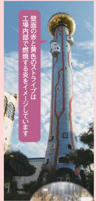
壁面の赤と黄色のストライプは工場内部で燃焼する炎をイメージしています

ほかにも公害防止設備、排水処理設備の完備など、周辺環境にも配慮された工場となっていました。