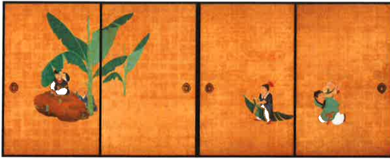
重要文化財「郭子儀図」 円山応挙 天明8年(1788) 兵庫・大乘寺蔵 京都展のみ:通期展示