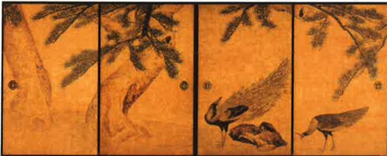
重要文化財「松に孔雀図」(全16面のうち4面) 円山応挙 寛政7年(1795) 兵庫・大乘寺蔵 京都展のみ:通期展示